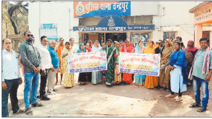
शिकायत लेकर थाना पहुंची ग्रामीण महिलाएं।