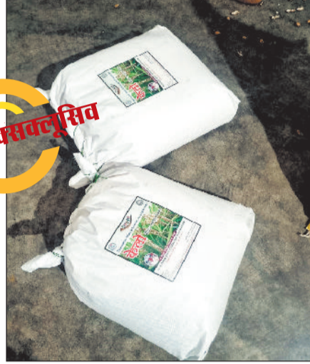
चावल खरीदी करने पहुंचा ग्राहक और पैकिंग जवाफूल चावल।

लॉट बुक करते समय लैलूंगा के किसानों के आंखों में सफलता की एक अलग ही चमक नजर आ रही थी। यह किसानों के साथ जिले के लिए भी खुशी और गर्व की बात है।